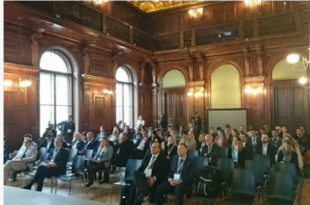
Forumi i Danubit për Qeverisjen në Ballkanin Perëndimor

Zhvillimi i kapaciteteve përmes trajnimeve dhe "workshop"-eve është një tjetër shtyllë e rëndësishme në programin e organizatës tonë. Krahas trajnimeve të ndryshme në bashkëpunim edhe me partnerë të tjerë, për vitin 2017, vlejné për tu veçuar dy prej tyre. Ndërto është trajnimi për "Hartimin dhe Zbatimin e Projekteve të BE" me pjesëmarrje