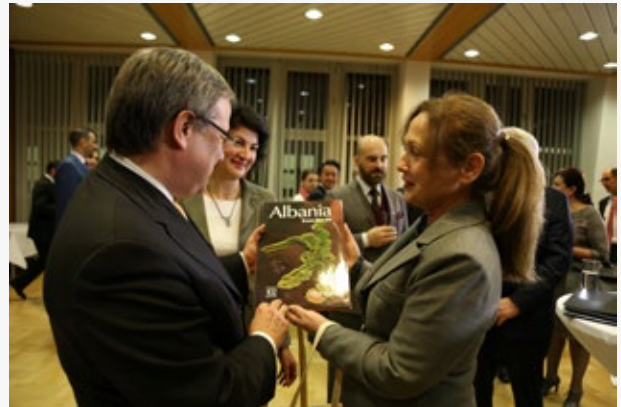
Me Kryeministrin e Landit të NWR, z. Armin Laschet

Këtë vit një fokus të veçantë ka zenë krijimi i urave të komunikimit mes bashkive vendase dhe atyre me përvojë evropiane. Marrja e përvojave dhe modeleve më të mira evropiane si dhe nxitja e bashkëpunimit përmes nënshkrimit të marrëveshjeve bilaterale dhe tërheqjes së projekteve dhe investimeve të huaja në lokalitetet shqiptare, ka qenë një prej bilanceve të suksesit për punën tonë gjatë vitit 2017. Vlen për tu përmendur vizita në rajonin në Emilia Romagna dhe atë në Landin e Veriut të Rhine-Vesfalisë, të Republikës Federale të Gjermanisë. Në të dyja këto vizita përpos lobimit në nivelet më të larta institucionale siç ishin takimet me komunitetin e biznesit, kryetarë bashkish të këtyre vendeve, anëtarë të parlamentit, ministra dhe kryministra, është bërë e