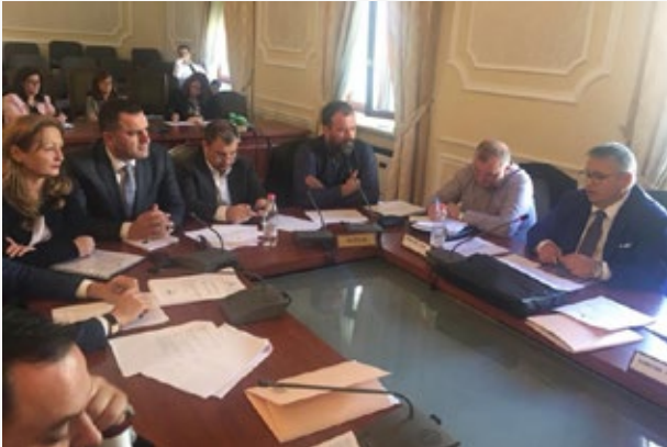
Komisioni Parlamentar për Çështjet Ligjore

gjerë ashtu edhe me grupet e interesit, duke përfshirë pjesëmarrjen dhe kontributin në hartimin dhe zbatimin e reformës së re territoriale në vend dhe të gjithë procesin shoqëruar të decentralizimit. Për vitin 2017, mund të përmendim kontributin e dhënë nga shoqata në kuadër të hartimit të ligjit të ri për financat publike në vend. Shoqata për Autonomi Vendore në bashkëpunim me grupin e punës së Ministrisë së Financave dhe ekspertët e USAID në Shqipëri kanë organizuar disa takime rajonale për të diskutuar mbi draft-projektligjin për financat e vetëqeverisjes vendore. Në këto takime morën pjesë kryetarët e 61 bashkive të vendit, drejtues të financave dhe specialistë, ekspertë të OJF-ve, dhe përfaqësues të komunitetit. Të gjitha opinionet e dala nga këto tryeza u vendosën në dispozicion MF, Këshillit Konsultativ dhe Komisionit Parlamentar për Çështjet Ligjore, Administratën Publike dhe Të drejtat e Njeriut.